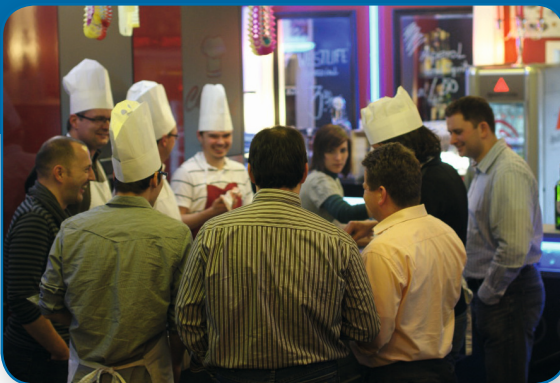
amotIQ solutions kocht!