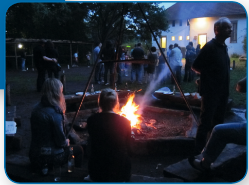
Grillabend am Sommerfest